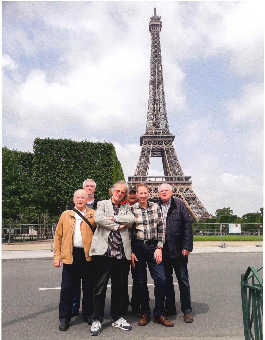
Die Kaarster Modellbahner sind in ganz Europa unterwegs, hier in Paris.

Neben der Möglichkeit, mit Menschen verschiedener Nationen zusammen zu kommen, lockt die IGM-Männer natürlich auch die Leidenschaft für ihr Hobby ins Vereinsheim. „Das Faszinierende ist der Bau. Die Anlagen werden immer weiter entwi-